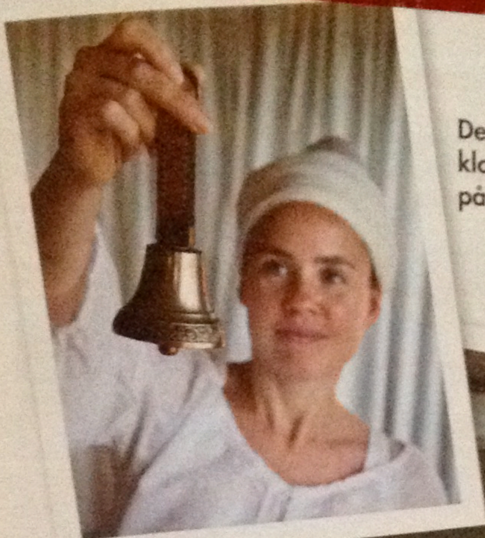
Deltagarna väcks med klosterpinglan vid fyra på morgonen.